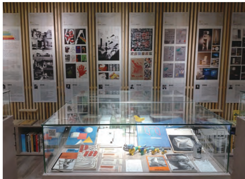
●圖5：於臺灣設計口西口展覽會場，展出臺師大設計系專兼任教師作品24幅掛軸