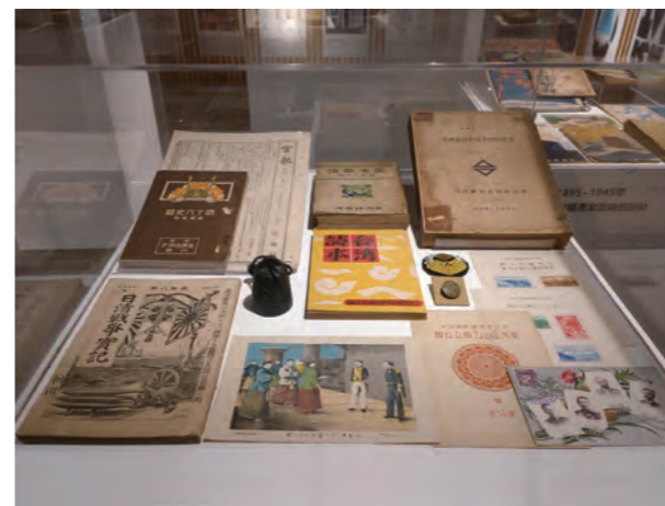
●圖15：第五展櫃，展出日治時期有關政治面向如統治台灣總督府官統計書、台灣事情、台灣讀本等設計

第十展櫃有日本因應太平洋戰爭於1937年至1945年期間所發動的皇民化運動的《皇民事典》，還有《畫報躍進之日本》，封