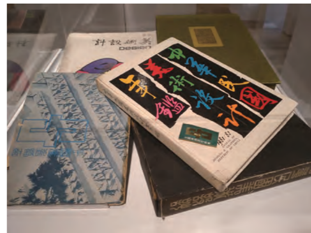
●圖25：第十五展櫃，展出1962年創立的中國美術設計協會第一本會刊《中國美術設計》，以及成立六十年來相關出版品