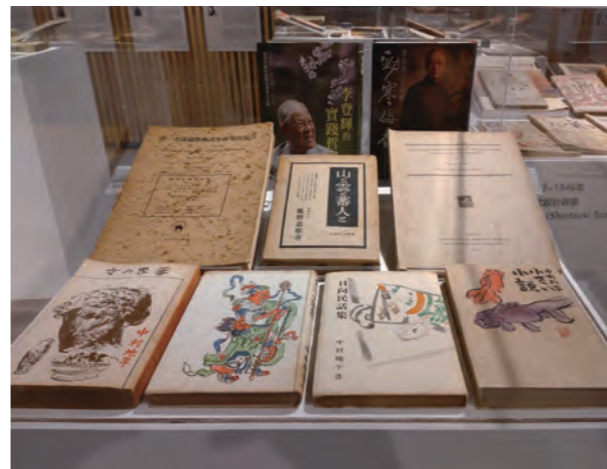
●圖13：第三展櫃，展出集人類學、生物學、民俗學於一身的理學博士鹿野忠雄，以及倡議南方文學影響台灣的中村地平著作；其中有鹽月桃甫及中川一政設計封面