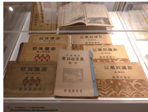
●圖17：第七展櫃，展出日治時期教育面向的國語讀本、公學校唱歌、初等圖畫等課本設計