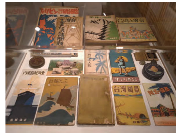
●圖16：第六展櫃，展出日治時期台灣產業面向如台灣林業、工業、農業、專賣、觀光等設計