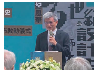
●圖6：臺師大吳正己校長出席本次展覽開幕致詞

1967~2012年國立臺灣師範大學時期，1975年臺師大美術系大三分組教學成立設計組，1981年美術研究所成立，1998年設計研究所獨立，2000年美研所設立在職碩士班設計組，2004年美研所碩士班成立藝術指導組，2006