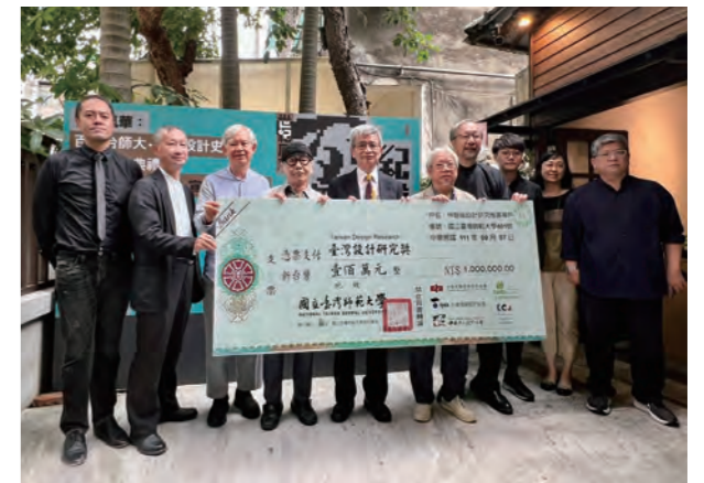
●臺師大校長及台灣設計社團協會理事長及代表、台灣設計界耆老共同出席展覽開幕典禮，並宣布啟動台灣設計研究獎計畫