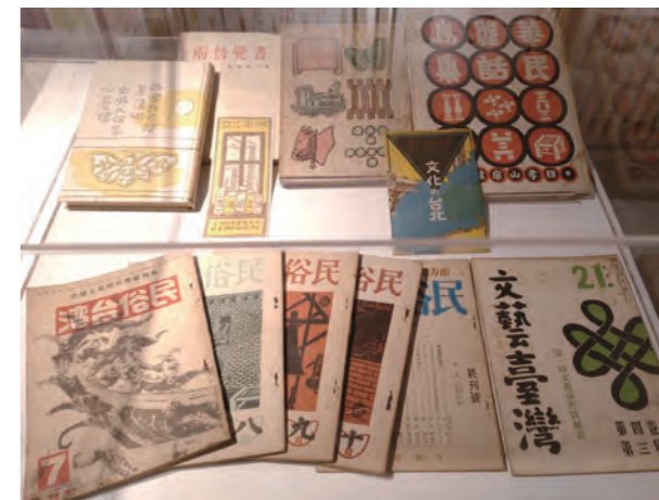
●圖18：第八展櫃，展出日治時期文化面相如西川滿、立石鐵臣、宮田彌太郎、中川一政等人設計