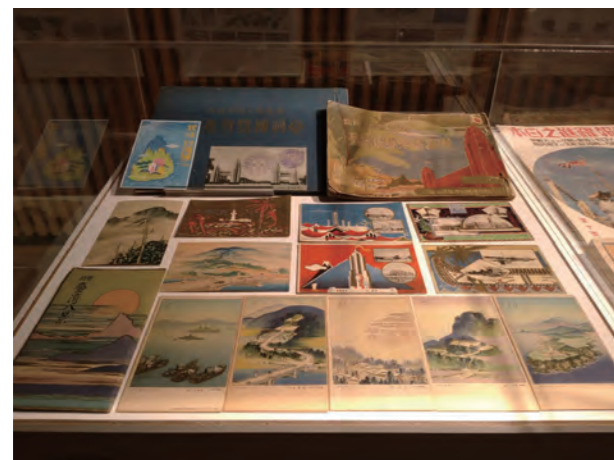
●圖19：第九展櫃，展出1935年始政四十年臺灣博覽會寫真帖、繪葉書、集印戰章及吉田出三郎所繪製的雙絕台灣八景繪葉書等

設計與印刷的功力；另外從《皇冠》與《雄獅美術》封面的仕女圖像，充分展現廖末林所擅長的裝飾藝術能力；與此相反的則是他為王藍著名小說《藍與黑》設計的封面，採用精簡的兩個矩形色塊，明確傳達書名的極簡風格；2010年國立歷史博物館出版《