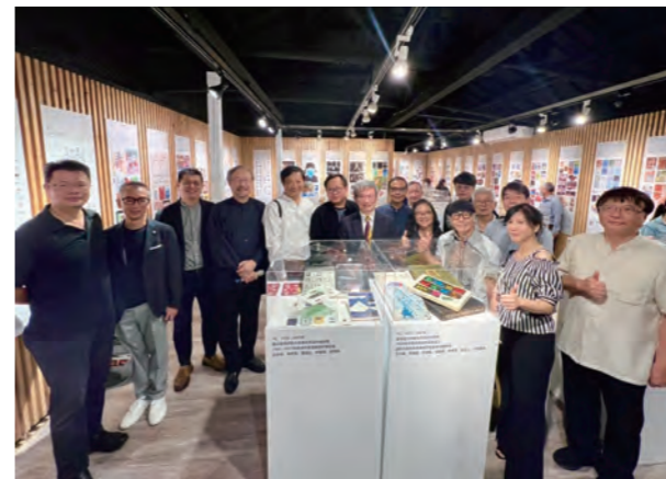
●台灣設計教育界、社團協會代表及台灣設計界耆老共同於展覽會場合影