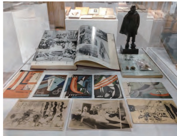
●圖11：第一展櫃，展出1922年創立臺北高等學校強調自由與自治學風的學生塑像、繪葉書等設計

北高校時編輯校刊《翔風》，展示其著作《蕃界之女》、《日向民畫集》、《台灣小說集》、《小さい小説》，前兩本是由鹽月桃甫封面設計，後兩本則是中川一政封面設計，這些各具風格特色的封面，都是台灣近代設計啟蒙時期重要史料。另外還有臺北高校