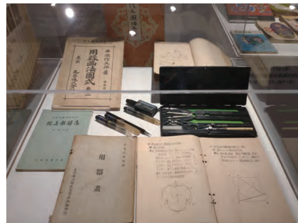
●圖21：第十一展櫃，展出1947年臺灣省立師範學院由創系主任莫大元創設勞作圖畫專修科的教材及用器畫工具