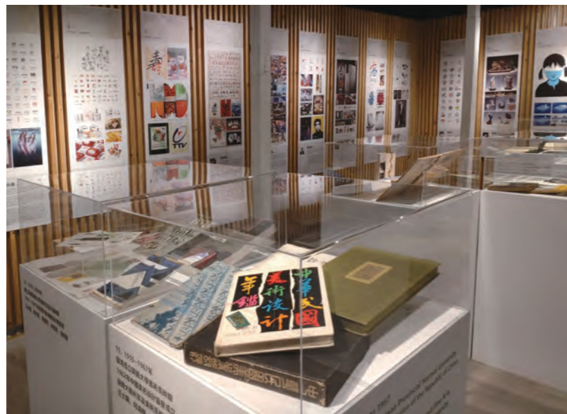
●圖4：於臺灣設計口東口展覽會場，展出百年來臺師大歷年師生作品54幅掛軸