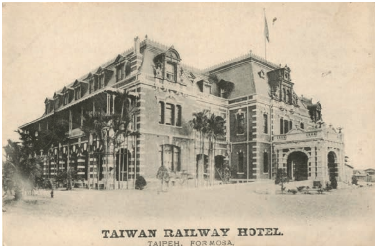
1908年落成啟用的台灣鐵道飯店，是由台灣總督府交通局鐵道部在台北車站前興建的一幢佔地3000餘坪的3層樓歐式紅磚建築，也是台灣第1間西式飯店，舉凡日治時期台灣政商重要的活動都在此舉行。

歐式紅磚建築，是台灣第一間西式飯店，當年啟用時的首位住宿客即是前來主持縱貫鐵路開通儀式的閑院宮載仁親王，可見其重要地位。