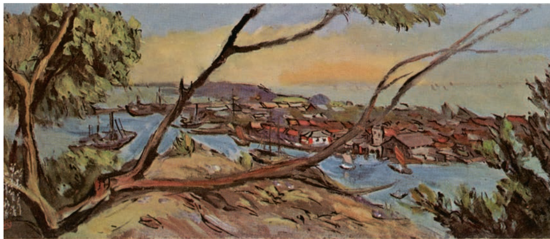
筆成秋澤小 選所役市雄高 後旗の艦濠市雄高