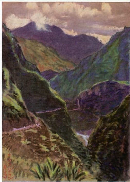
Taroko Gorge: Magnificent canyon.