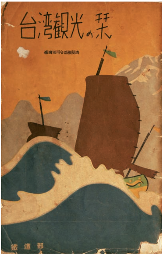
1938年台灣總督府交通局鐵道部發行的《台灣觀光之栞》，以剪影圖案形式描繪2艘戎克船行駛於巨大海浪，背景是高聳的山脈，展現台灣依山近海的氣勢。