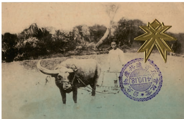
1908年配合台灣縱貫鐵路開通，以台北新起街市場八角堂（現西門紅樓）做為主要展場舉辦了「台北物產共進會」，展售來自日本內地的農畜產品、工藝品、水產、器械等。台北物產共進會紀念繪葉書在水牛黑白照片右上方的台北物產共進會標誌，是以台灣總督府的「台」字及「共進會」的「共」字組成放射光芒的意象。