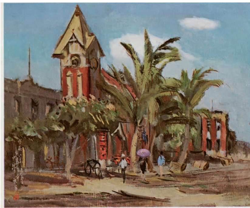
小澤秋成 埠頭の建物 1934 明信片 收錄於《高雄紹介》 高雄市役所發行