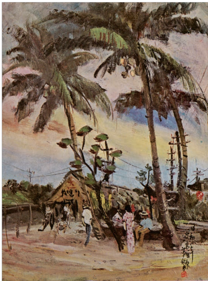
筆成秋澤小 選所役市雄高 前驛雄高