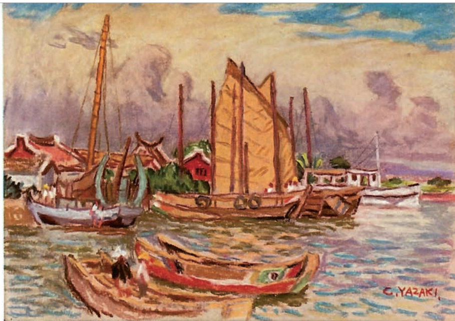
funks; Attractive existence in Taiwan.