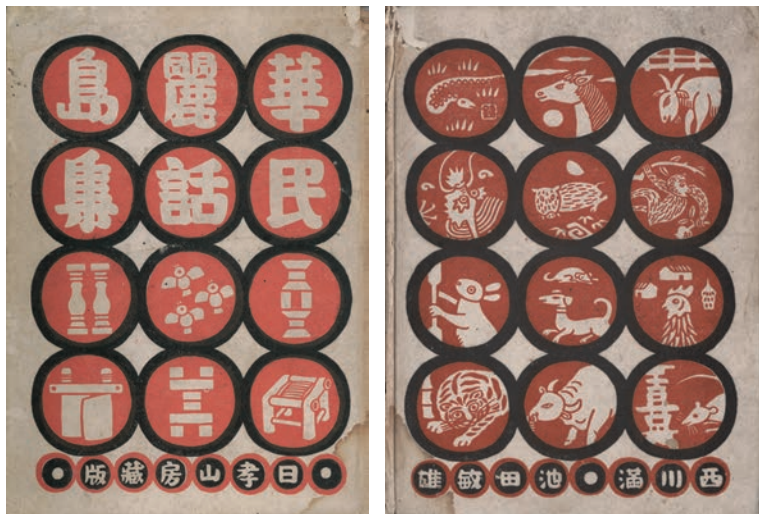
西川滿、池田敏雄 華麗島民話集 1942 日孝山房出版

西川滿在台期間編輯、出版多種有關華麗島的書刊，其中最具代表性的是1939年12月1日台灣詩人協會創刊的機關雜誌《華麗島》，由他擔任發行人、北原政吉為編輯，主要蒐錄在台日人及台籍作家創作的新詩；雖然僅創刊發行一期即告終止，但是成為台灣文學的重要里程碑。1940年1月1日台灣詩人協會改組為「台灣文藝家協會」，並且發行《文藝臺灣》。另外，西川滿於1939年在北文堂骨之木社發行的《骨之木》（骨の木）第三卷第三號發表〈華麗島古代蕃歌〉，1940年於日孝山房出版《華麗島頌歌》；1942年與池田敏雄合著《華麗島民話集》，由灣生立石鐵臣繪製封面及插