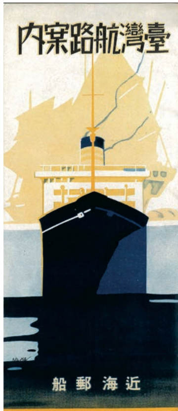
1933年近海郵船株式會社發行的《臺灣航路案内》，前景是正面迎來的黑色巨型商船，背景則是淺黃色的台灣傳統戎克船，設計明顯是受到1920年代至1930年代裝飾藝術風格影響。右·1934年9月大阪商船株式會社發行的《去台灣》，以台灣特有物產香蕉葉交織出強烈的藍綠雙色對比，其中銀色蕉葉內有大阪商船的黑白照片。

「華麗島」的稱謂也多次出現在日治時期以迄戰後的文學出版，先後有1960年北原白秋的《台灣紀行·華麗島風物誌》、1974至1975年日影丈吉的《華麗島志奇》、1977年鈴木滿男的《華麗島見聞記—東亞政治人類學筆記》（華麗島見聞記—東アジア政治人類学ノート）；1981年，研究台灣考古與民俗重要學者國分直一在新日本教育圖書出版的雜誌《えとのす》第十五號，收錄〈華麗島的民族〉；1992年范姜房枝編《華麗島歌集：コスモス台灣支部合同歌集》、1993年北原政吉著《華麗島詩月紀行》、1996年島田謹二著《華麗島文學志：日本詩人の台灣體驗》（華麗島文学志：日本詩人の台湾体験）；2000年由前嶋信次著作、杉田英明編輯的《「華麗島」從台灣的眺望》（〈華麗島〉台湾からの眺望）；2012年橋本恭子著《〈華麗島文學志〉及其時代：比較文學者島田謹二の台灣體驗》（「華麗島文学志」とその時代：比較文学者島田謹二の台湾体験）等。由此可見，對於當時的日本文化人士而言，台灣是個充滿陽光、生氣盎然、多彩多姿的華麗島嶼，更有豐富多元的文史內涵與文化想像值得加以挖掘。