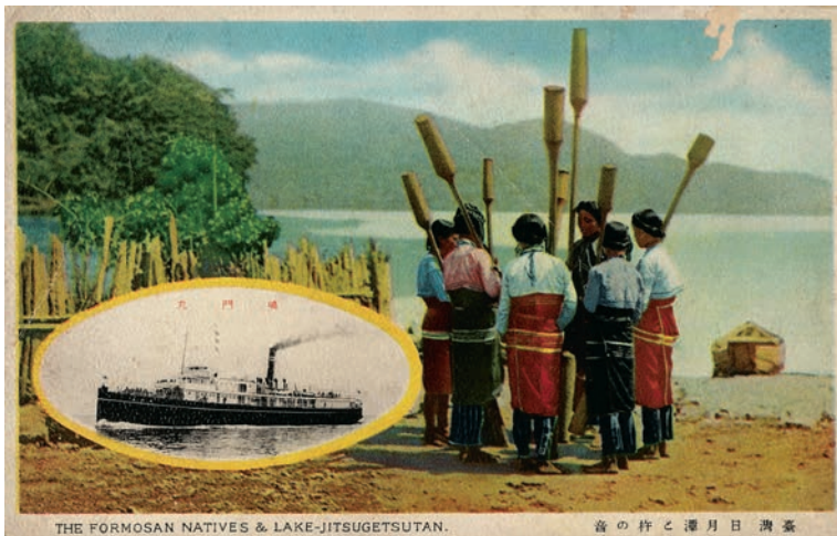
大阪商船株式會社發行的明信片〈臺灣日月潭與杵音〉上可見鳴門丸輪船，這個日月潭原住民杵音的畫面屢屢出現在日治時期觀光明信片，成為華麗島的經典圖象。