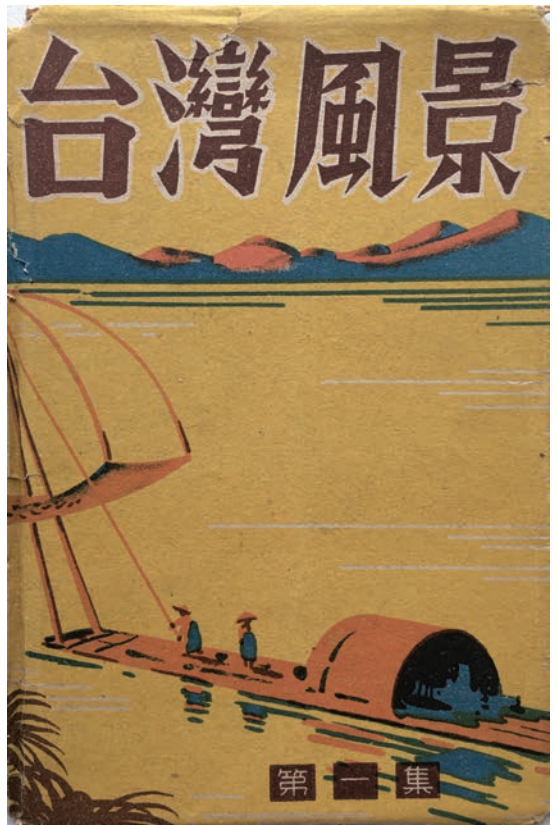
右。1939年的《台灣風景》第1集明信片彩色封套，描繪頭戴斗笠的漁夫在風平浪靜的竹筏之上進行捕撈作業，反映日治時期台灣只有竹筏及戎克船在沿海捕魚的情景。